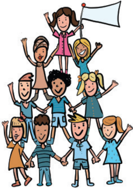
Met Klasse(n)Kracht kun je de negatieve groepsdynamiek in een klas omdraaien.

geleerd over wie ik ben en hoe ik me verhoud tot anderen. Maar het heeft me ook veel meer inzicht gegeven in de onderstroom bij mezelf en bij anderen.”