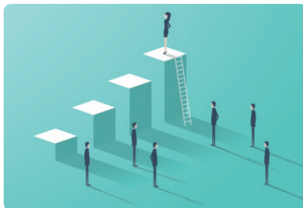
Van der Coer: "Pas na een jaar of zes, zeven heb je het vak van schoolleider in de vingers."

woordt, dat je naar ieders pijpen loopt te dansen, maar ondertussen je eigen muziek kwijtraakt?