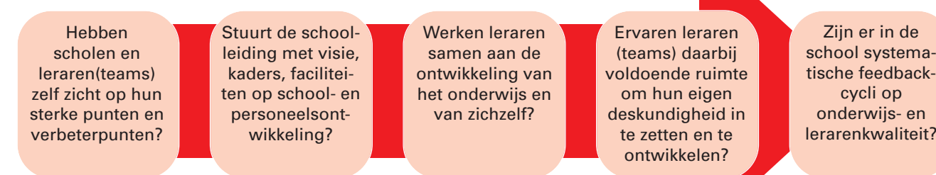
Kwaliteitscyclus professionalisering en schoolontwikkeling

In het onderzoeksrapport Professionalisering als gerichte opgave van de Inspectie van het Onderwijs is de kwaliteitscyclus van professionalisering en schoolontwikkeling in een schema gevisualiseerd, met daarbij een aantal voorbeelden van de verschillende elementen.